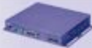
VIDEOFACTORYPLAYER VFP 1010