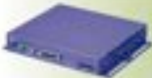
VIDEOFACTORYPLAYER VFP 410