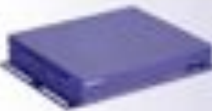
VIDEOFACTORYPLAYER VFP 210