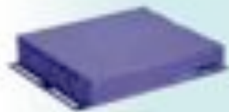
VIDEOFACTORYPLAYER VFP 110