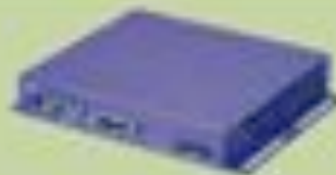
VIDEOFACTORYPLAYER VFP 810