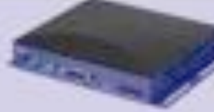
VIDEOFACTORYPLAYER VFP 1010 W